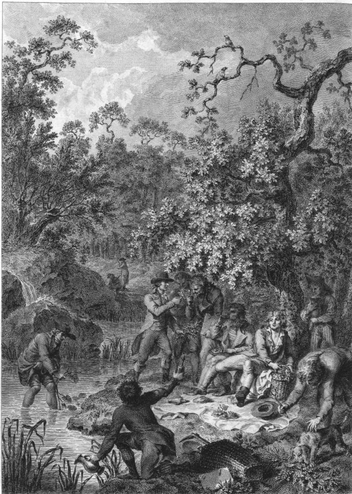
B. Guerin. inv. et sculp.

Pour tenter son savoir quelquefois leur malice De plusieurs végétaux compose un tout factice; Le sage l'aperçoit, sourit avec bonté, Et rend à chaque plant son débris emprunté.